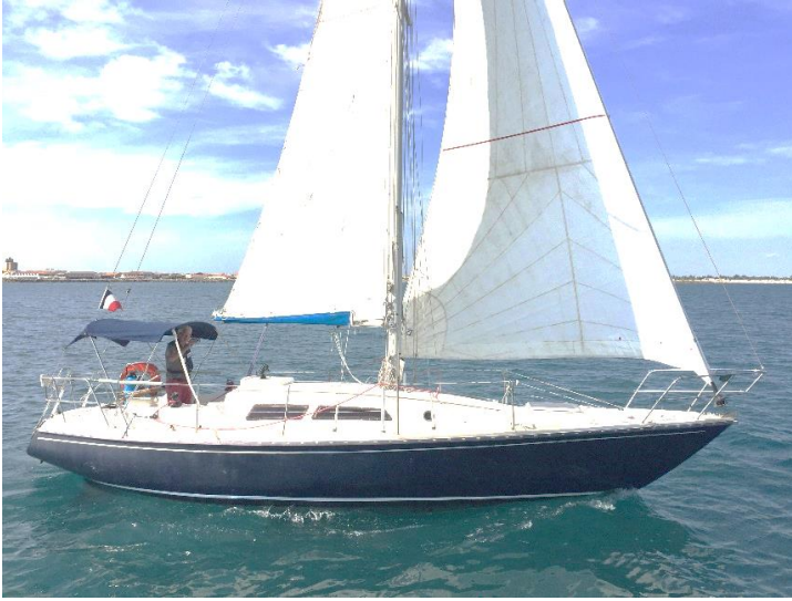
Au large de Port Camargue

Génois 40m 2 coupe tri-raduite, GV 20m 2 3 bandes de ris