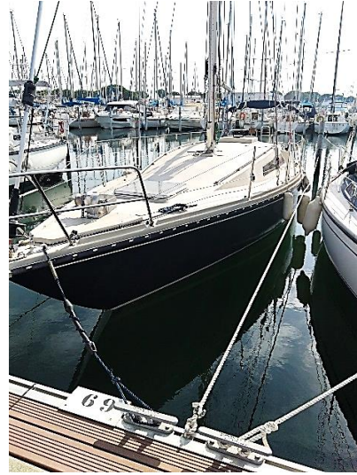
mouillage Port Camargue